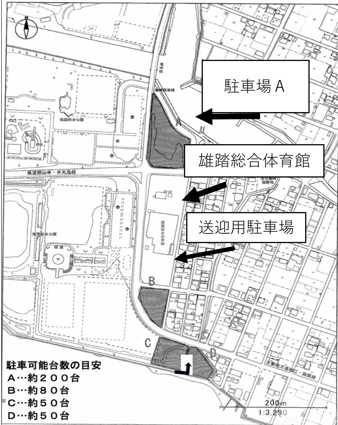
臨時駐車場 位置図